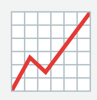
Tabla Resumen de Mitigación de Riesgos

Para comprender la prioridad de implementación, consulte el siguiente análisis de impacto: